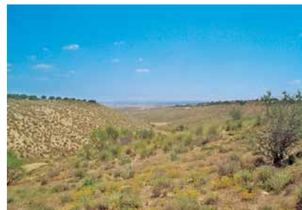
Figura 3. Paisajes con escasa influencia humana y escaso valor estético. Fotografía del autor, mayo de 2008.

características, en la medida en que permite obtener información sobre el valor del paisaje. No parece acorde la simplificación que se realiza de la calidad, que trata de eliminar el componente subjetivo y se limita a considerarla como intrínseca objetiva, puesto que la exclusión de la subjetividad conlleva a la eliminación de la percepción.