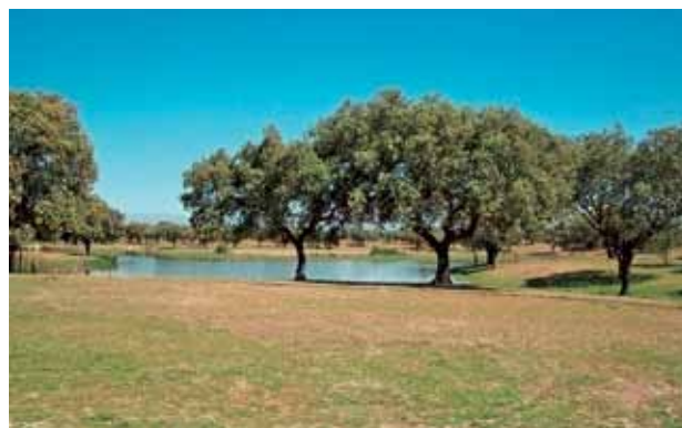
Figura 2. Paisajes con elevada influencia humana y elevado valor estético. marzo de 2009.

El indicador de calidad podría ser acorde con las exigencias para la gestión del paisaje derivadas de sus